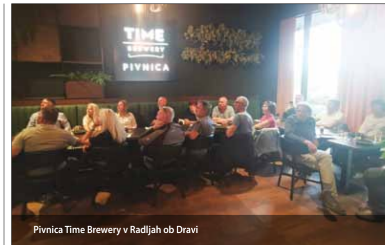
Pivnica Time Brewery v Radljah ob Dravi