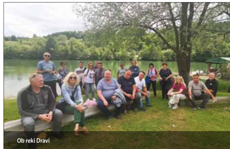
Ob reki Dravi

Naše popotovanje po čudoviti Koroški smo zaključili na Turistični kmetiji Ravnjak , ki leži pod košato razgrnjenim gozdnim plaščem Uršlje gore in na nadmorski višini 760 metrov. V idilčni naravi pod spretno roko gospodarice Brede, smo okušali prave koroške jedi. Aktivni in navdse zanimiv dvodnevni izlet, nam bo, zahvaljujoč tudi sončnemu vremenu, ostal v lepem spominu.