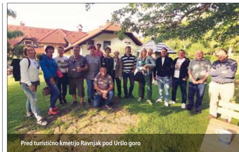
Pred turistično kmetijo Ravnjak pod Uršlo goro