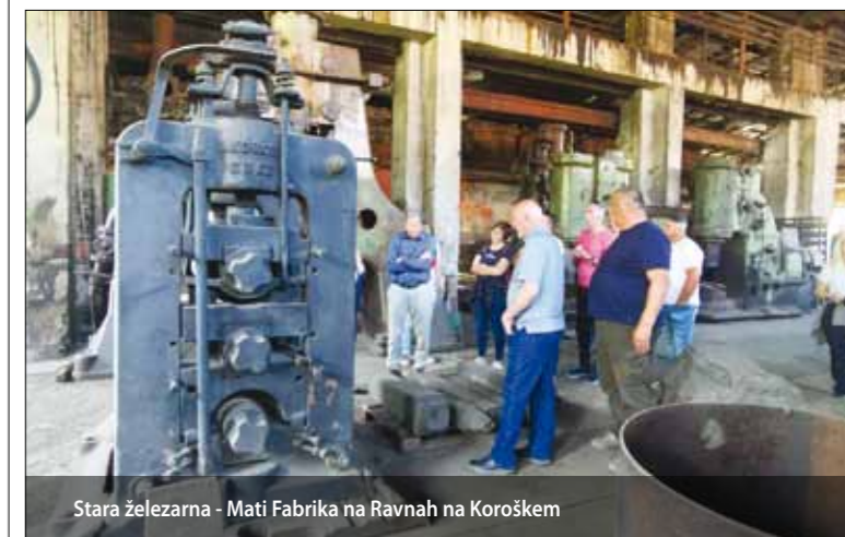
Stara železarna - Mati Fabrika na Ravnah na Koroškem