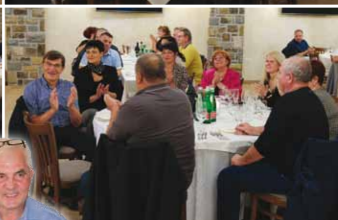
Utrinki s slavnostne skupščine