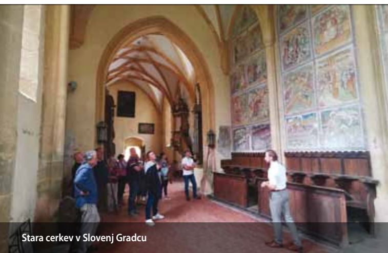
Stara cerkev v Slovenj Gradcu