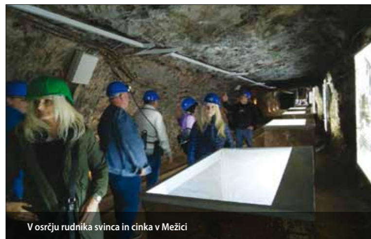
V osrčju rudnika svinca in cinka v Mežici