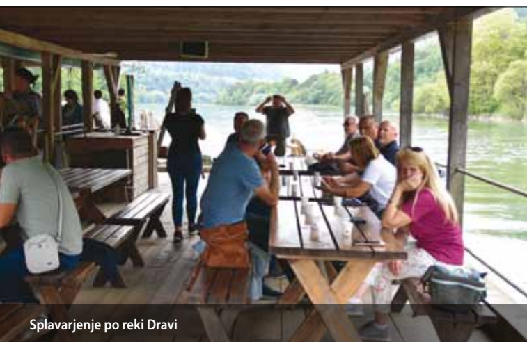
Splavarjenje po reki Dravi