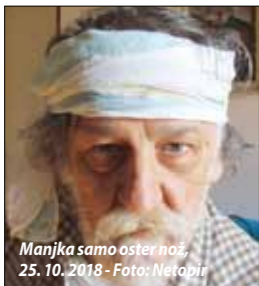
Manjka samo oster nož, 25. 10. 2018

Veliko lažje bo vsem, ko se bomo lahko tudi formalno pogovorili, uskladili in začeli reševati stvari.