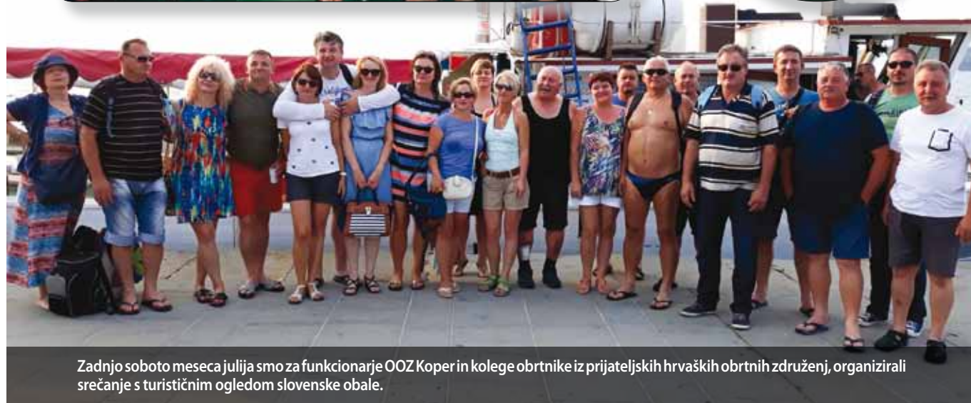
Zadnjo soboto meseca julija smo za funkcionarje OOO Koper in kolege obrtnike iz prijateljskih hrvaških obrtnih združenj, organizirali srečanje s turističnim ogledom slovenske obale.