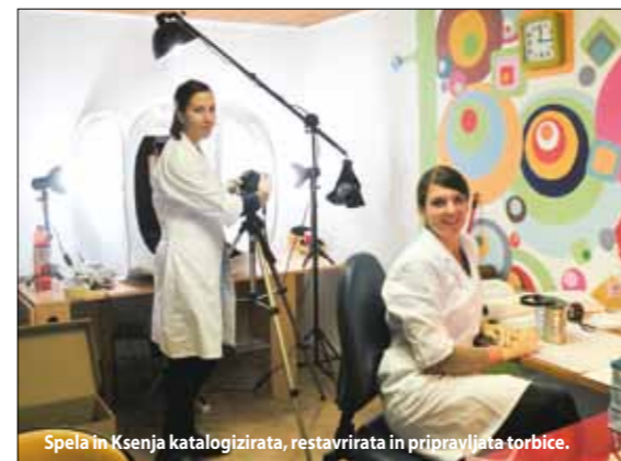
Spela in Ksenja katalogizirata, restavrira in pripravljata torbice.

Za svojo današnjo slavo najeminentnejšega imena na področju turizma in skupaj s Piranom tudi na področju turistične zgodovine Slovenije, se Portorož lahko v veliki meri zahvali tudi damam, ki so že na začetku 19. stoletja poleg bližnjega Dunaja, Benetk in Opatije izbirale tudi Portorož kot kraj, kjer so se postavljale z najvišjo evrop-