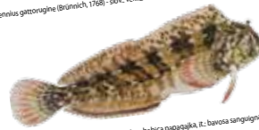
180. Parablennius sanguinolentus (Pallas, 1811) - slo: babica papagajka. it: bavotta sanguignia. htc: slingura makuha