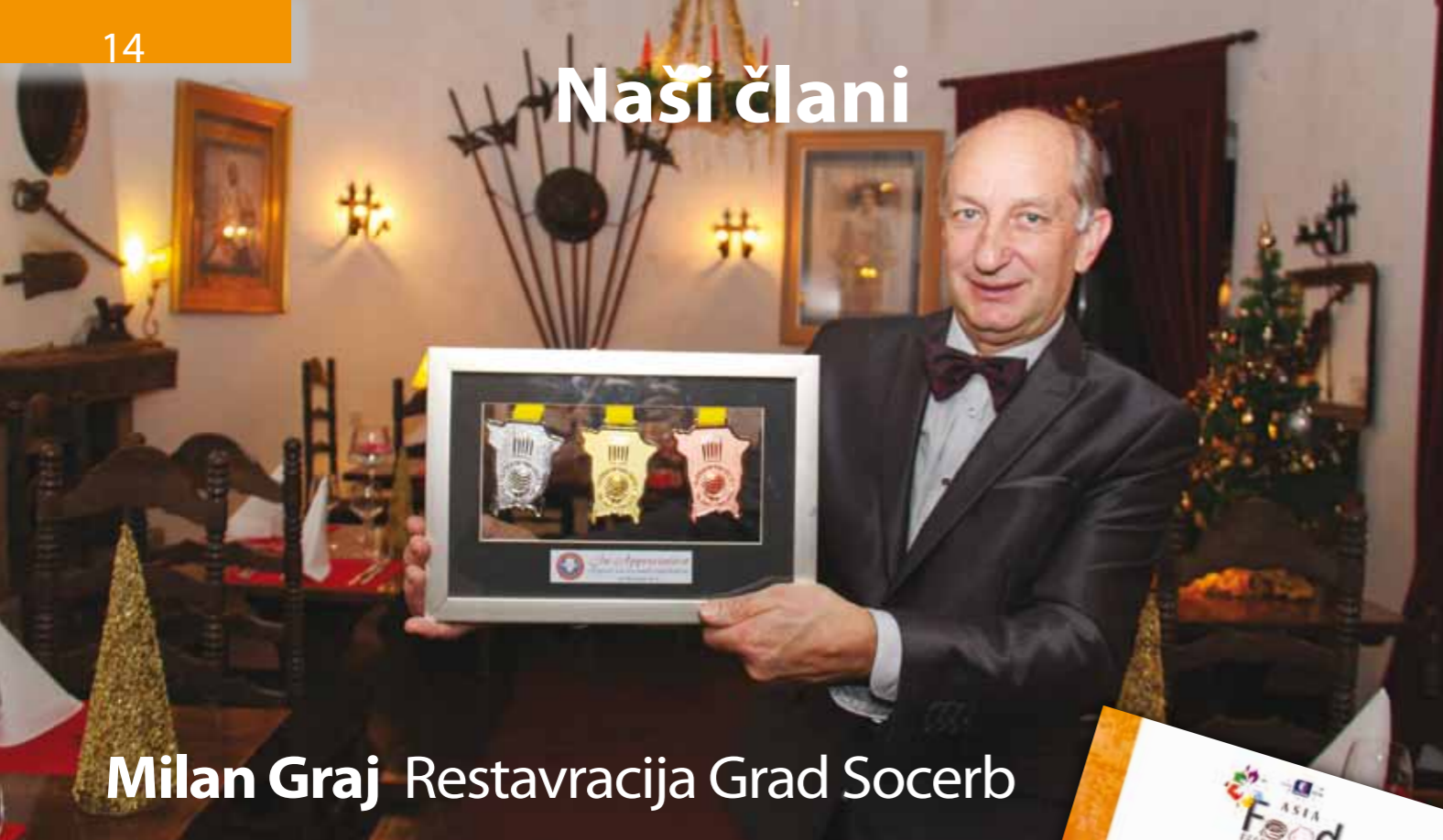
Milan Graj Restavracija Grad Socerb