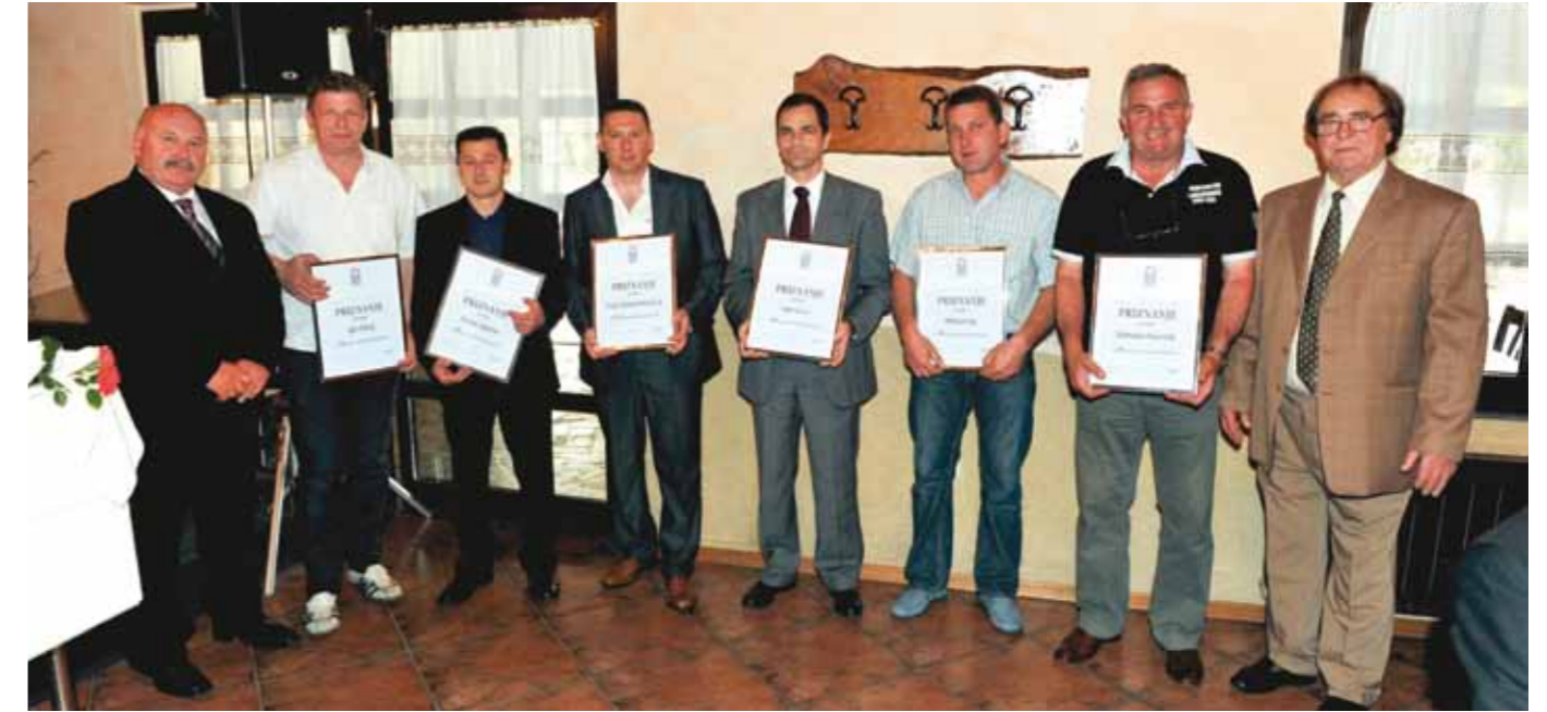
18. Foto Levac d.o.o. Koper - fotografstvo 19. Freeze system Šmerc k.d. - inst. pri gradnjah 20. Geoit d.o.o. Ankaran - gradbeništvo 21. Gipo d.o.o. - strojno instalaterstvo 22. Higrad d.o.o. - gradbeništvo