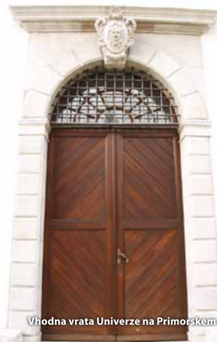
Vhodna vrata Univerze na Primorskem

Radio Koper je v oddajo »Nedelja z mladimi« enkrat mesečno vpeljal tudi predstavitev zanimivih poklicev. V decembru so najmlajšim (otrokom v vrtcu in šolarjem) na obisk pripeljali mizarja - restavracijsko. Po domiselnih in iskrenih (pa