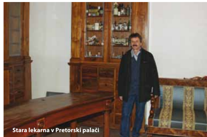
Stara lekarna v Pretorski palači