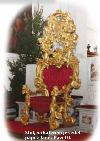
Stol, na katerem je sedel papež Janez Pavel II.