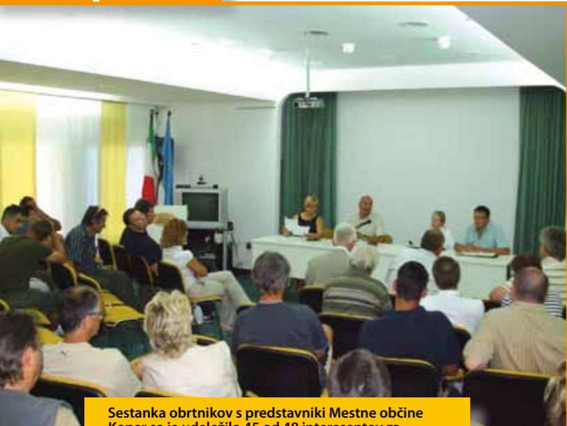
Sestanka obrtnikov s predstavniki Mestne občine Koper se je udeležilo 45 od 48 interesentov za nakup zemljišč v obrtni coni.