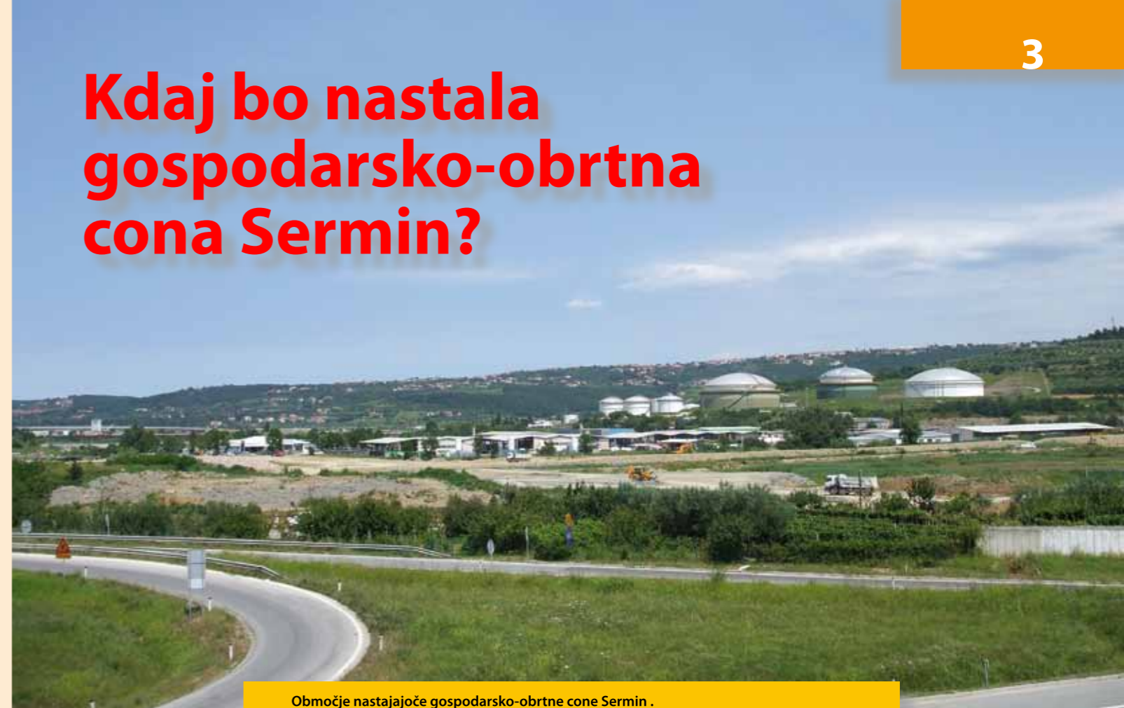
Območje nastajajoče gospodarsko-obrtna cone Sermin .

Pretekli teden so se v zeleni dvorani Obrtniškega doma srečali predstavniki obrtnikov in Mestne občine Koper, da bi se uskladili in dokončno dogovorili o nadaljevanju odkupa zemljišča nastajajoče obrtna cone. Kljub opravljenem razpisu in obljubam, da bo 48 obrtnikov lahko v najkrajšem možnem času dejansko podpisalo pogodbo, s katero bi odkupili zemljišče, MOK do prejšnjega tedna pogodb še ni pripravila. Vzrok za to je nedokončano usklajevanje občine z dosedanjimi lastniki zemljišča, na katerem bi nastala cona. Rok za podpis pogodbe pa se je v začetku julija začel iztekati, saj bi pogodba namreč morala biti podpisana v roku 6 mesecev po izvedenem razpisu.