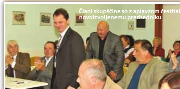
Člani skupščine so z aplavzom čestitali novoizvoljenemu predsedniku