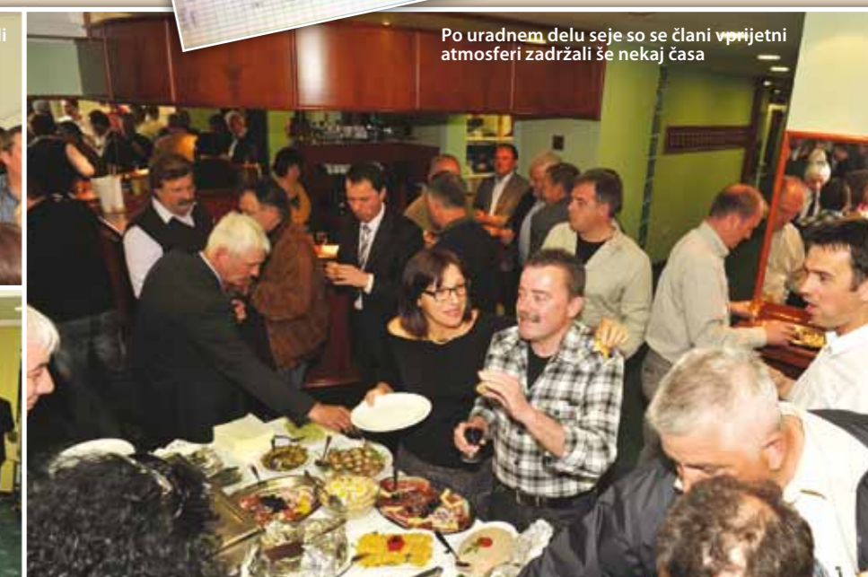
Po uradnem delu seje so se člani v prijetni atmosferi zadržali še nekaj časa