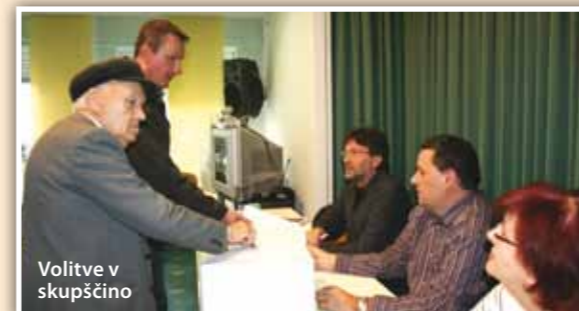
Volitve v skupščino

zadevo nenehno spremljati, ostrino zahtev stopnjevati, vladi ne dati dihati. Da bodo vedeli, da imajo resnega sogovornika. Zbornične službe dobro opravljajo svoje delo. Na nas pa je, da ga spremljamo, podpiramo, da z njihovo pomočjo sledimo novim uredbam, zakonom, o čemer nas redno obveščajo preko mailov, SMS sporočil in časopisa. Kdor to prebira, lahko, preden zabrede v težave, reši marsikak problem.«