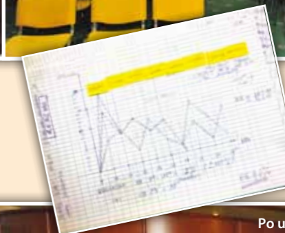
Malo za šalo - malo zares... Tudi tako je volilna komisija spremljala udeležbo na volitvah. Z grafikonu in jemanjem prstnih odtisov tistih, ki s seboj niso imeli dokumentov. Seveda so bili odtisi za šalo.