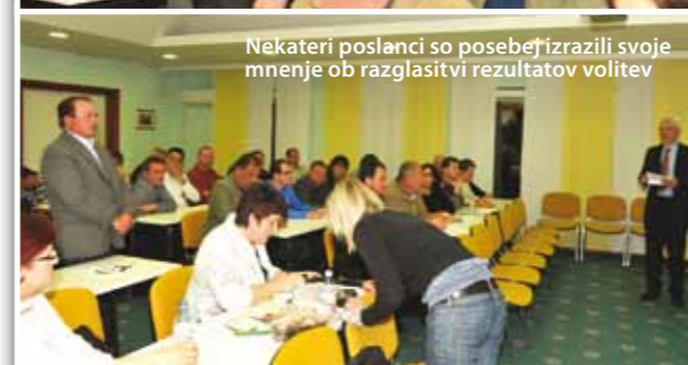
Nekateri poslanci so posebej izrazili svoje mnenje ob razglasitvi rezultatov volitev