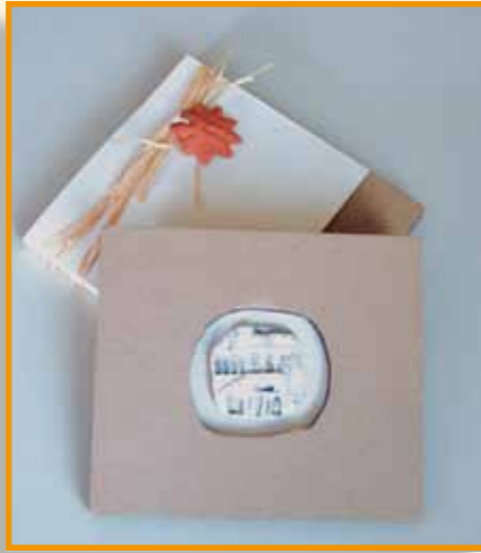
Nagrajeni spominek - Pretorska palača kot simbol Kopra.

»Prav v tem je težava. Mislim, da bi morala občina poskrbeti za to in promovirati te spominke. Na primer, da bi jih ponudila različnim podjetjem, ki bi jih uporabili kot poslovna darila. Tudi obrtna zbornica bi, na primer, lahko odkupila več kosov, ki bi jih podarila. Ta natečaj nima nobenega pomena, če bo moj spominek stal tukaj v trgovini in