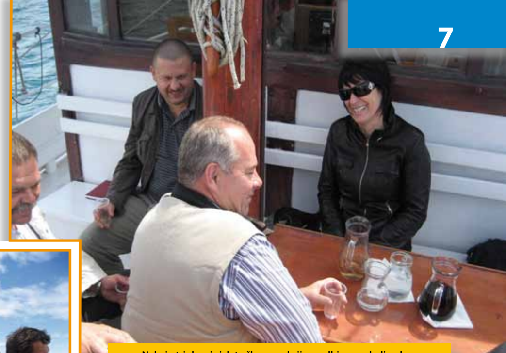
Nekaj utrinkov iz izleta članov sekcije gradbincev z ladjo ob slovenski obali

Od Obrtno-podjetniško zbornico Slovenije, gradbinci pričakujejo odgovore in pojasnila na njihova vprašanja in opozorila.