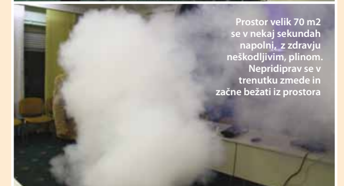
Prostor velik 70 m 2 se v nekaj sekundah napolni, z zdravju neškodljivim, plinom. Nepridiprav se v trenutku zmede in začne bežati iz prostora