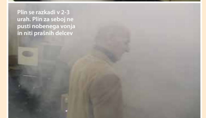
Plin se razkadi v 2-3 urah. Plin za seboj ne pusti nobenega vonja in niti prašnih delcev