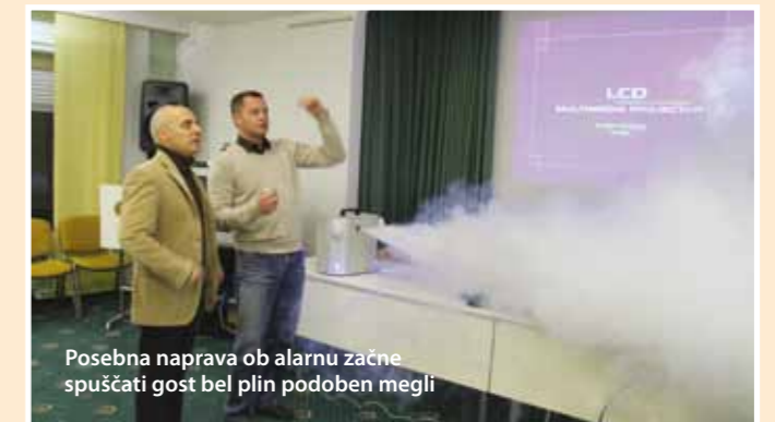
Posebna naprava ob alarnu začne spuščati gost bel plin podoben megli