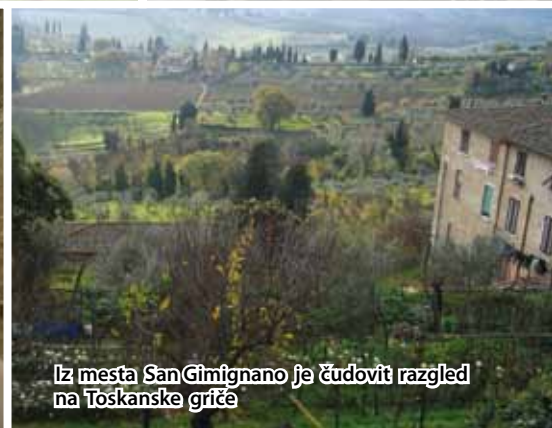
Iz mesta San Gimignano je čudovit razgled na Toskanske griče