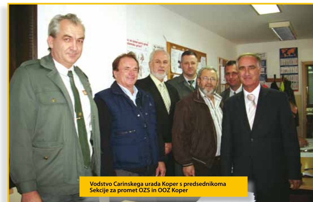
Vodstvo Carinskega urada Koper s predsednikoma Sekcije za promet OZS in OZS Koper