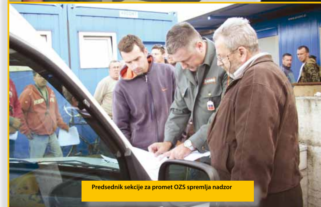
Predsednik sekcije za promet OZS spremlja nadzor