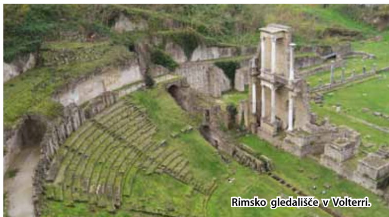
Rimsko gledališče v Volterri.