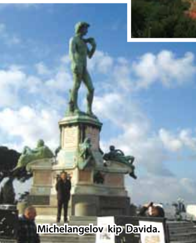
Michelangelov kip Davida.