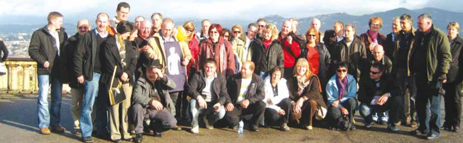
Skupinska slika iz trga Michelangelo, od koder je čudovit pogled na Firence.