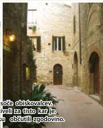
Utrinki iz mesta, kjer se običajno tare na tisoče obiskovalcev. Srečo smo imeli, da smo lahko mesto doživeli za tisto kar je. Vse je tako kot je bilo, zato smo vsakem koraku občutili zgodovino.