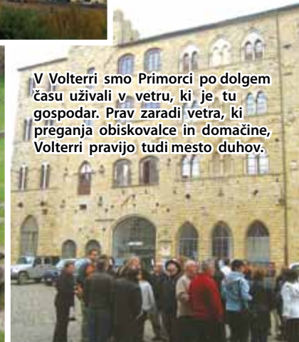
V Volterri smo Primorci po dolgem času uživali v vetru, ki je tu gospodar. Prav zaradi vetra, ki preganja obiskovalce in domačine, Volterri pravijo tudi mesto duhov.